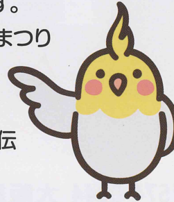
(大東キャンドルナイト出店)

午前中の作業では、内職などの軽作業やチラシ配り、午後の趣味活動では、カラオケをしたり、パズルや絵本を見たり、畑で農作業をしたりしています。また月に1度は課外活動で、障がい者スポーツセンターに行ったり、社会見学に行ったり、季節のフルーツ狩り等で自然を満喫したりしています。1年間のイベントとして、大東市民まつりや、大東キャンドルナイト、介護の日フェスティバル、三好長慶武者行列などに参加してバザー等のお手伝いを行っています。